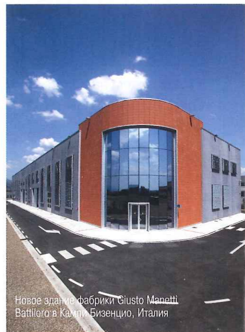
Новое здание фабрики Giusto Manetti Battiloro в Кампи Бизенцио, Италия